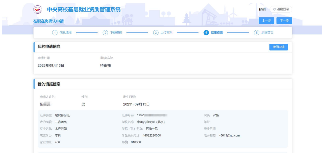
图 2- 25 结果查看页面

确认无误后点击<提交>按钮，即填报完成，申报入口处状态变成待审核，提交之后，学院审核之前，可以撤回申请。