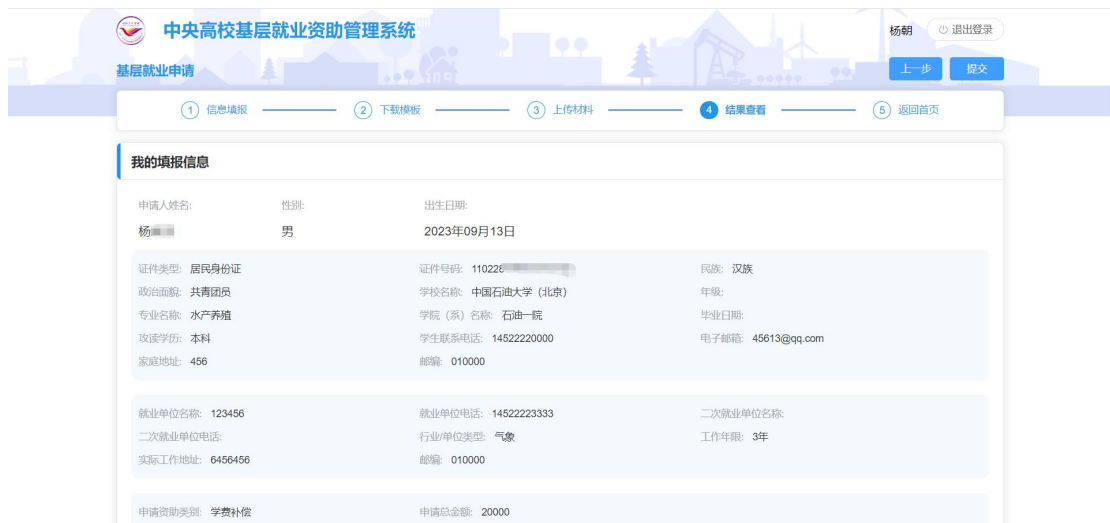
图 2- 19 基层就业复核结果查看页面

确认无误后点击<提交>按钮，即填报完成，申报入口处状态变成待审核，提交之后，学院审核之前，可以撤回申请。