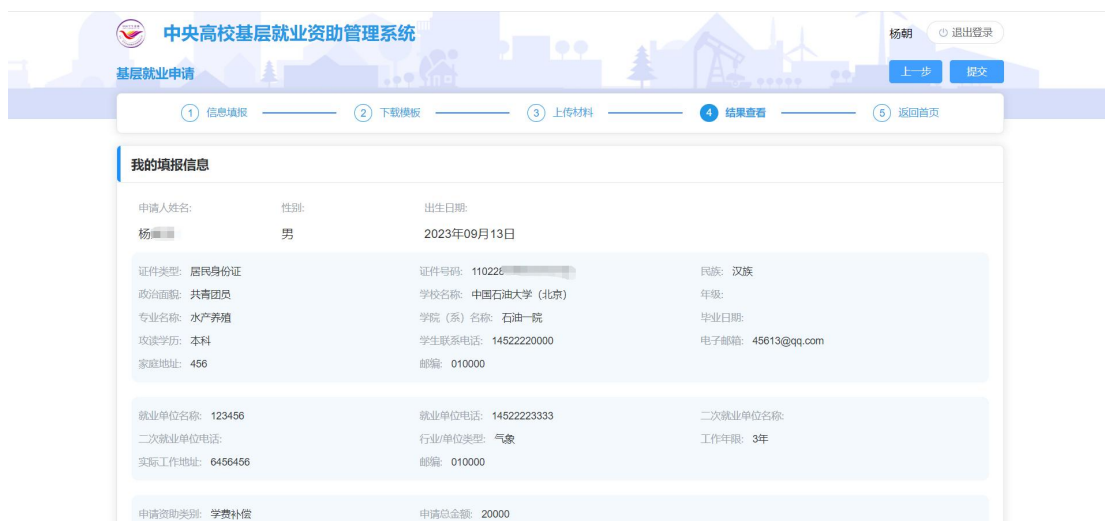
图 2- 11 基层就业结果查看页面