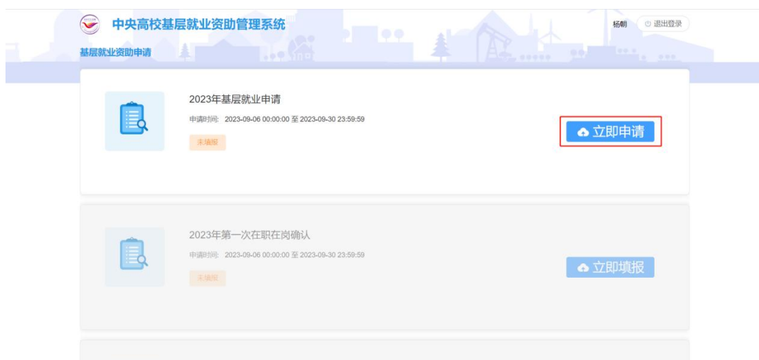
图 2- 6 基层就业申请入口

登陆系统后，在要求的申请时间范围内，并且没有提交过申请的学生，可以点击基层就业申请模块的<立即申请>按钮，如图：