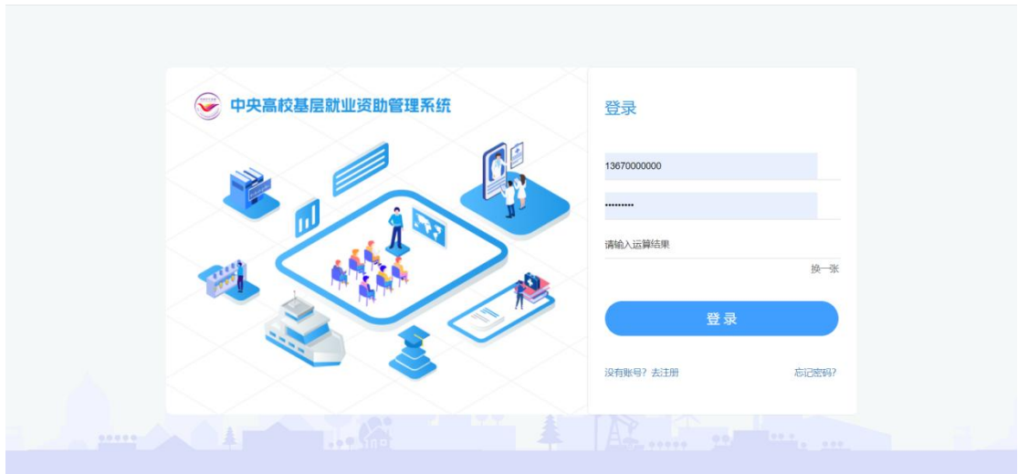
图 2- 4 学生登录页面

在弹出的忘记密码页面填写相关信息，密码需符合页面密码强度要求，点击<修改密码>按钮，即可修改成功，如图：