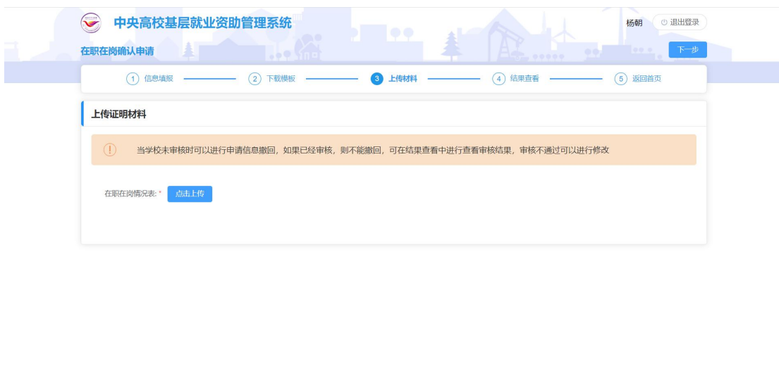
图 2- 30 上传证明材料页面