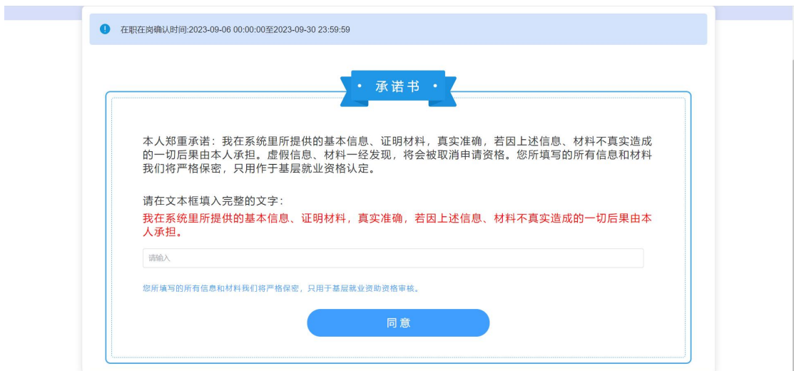
图 2- 27 承诺书