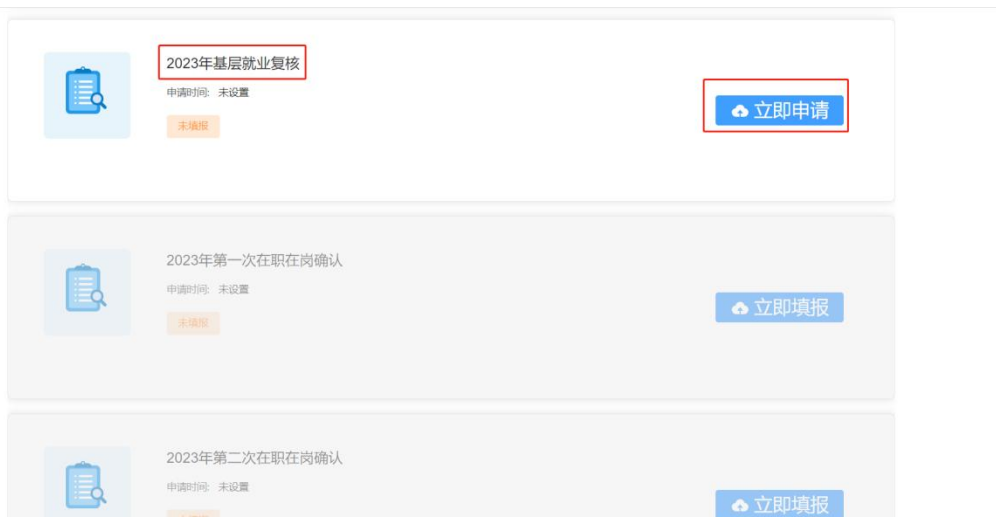
图 2- 14 基层就业复核填报入口