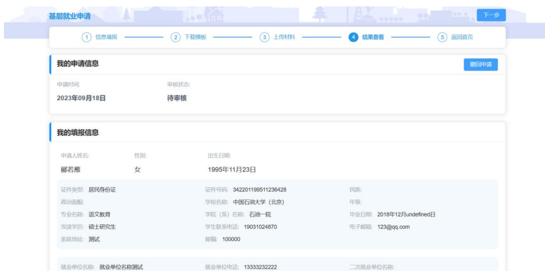
图 2- 13 基层就业撤回申请页面