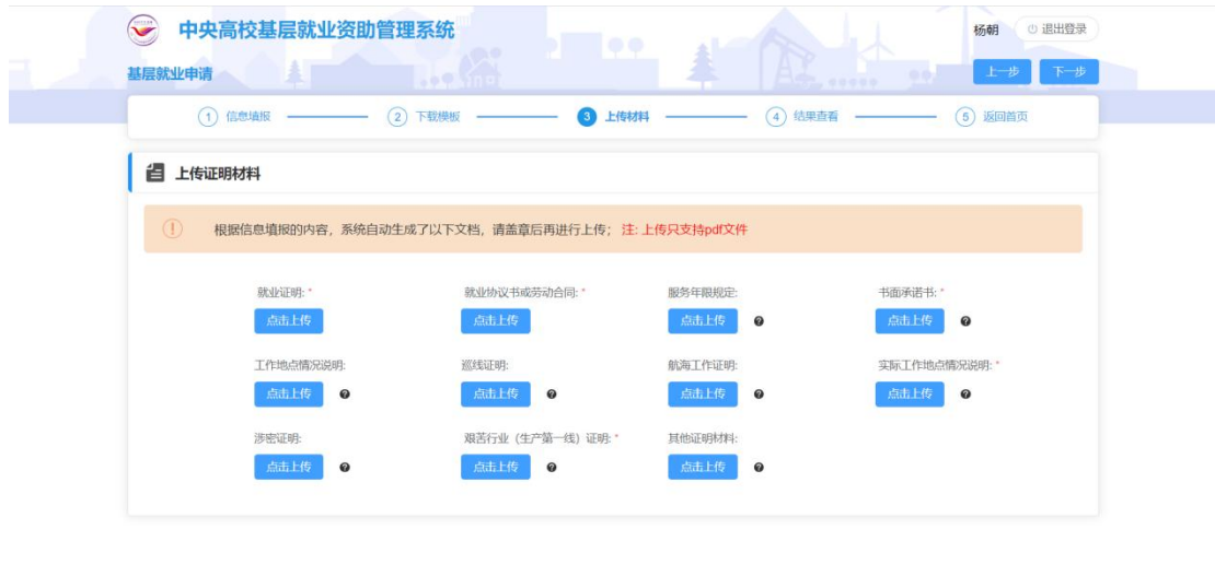
图 2- 18 基层就业复核上传证明材料页面