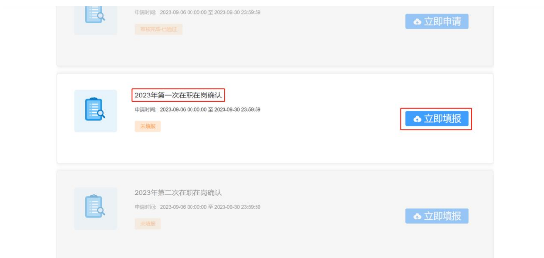
图 2- 20 第一次在职在岗确认入口页面

提交基层就业申请通过的学生第二年可以在要求的在职在岗时间范围内填报第一次在职在岗确认信息，点击第一次在职在岗确认模块的<立即申请>按钮，如图：