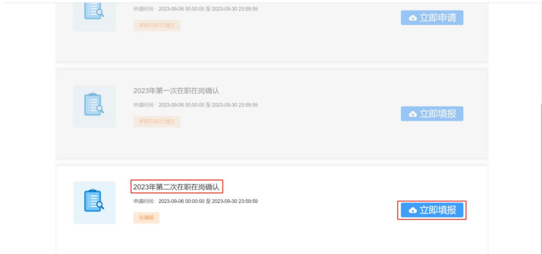
图 2- 26 第二次在职在岗确认入口页面

时间范围内填报第二次在职在岗确认信息，点击第二次在职在岗确认模块的<立即申请>按钮，如图：