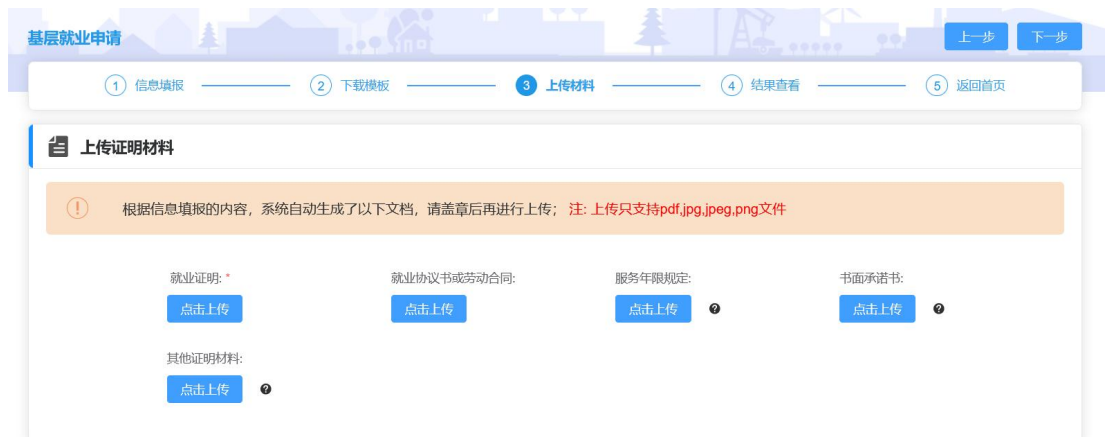
图 2- 10 上传证明材料页面